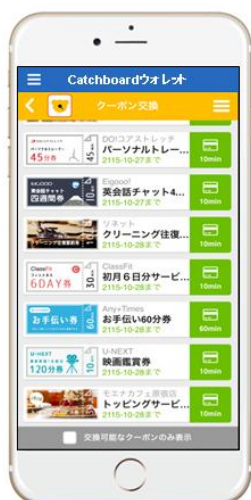
交換可能クーポン一覧