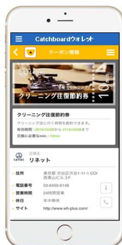
オンラインクーポン利用