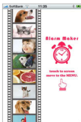
Alarm Maker トップ画面