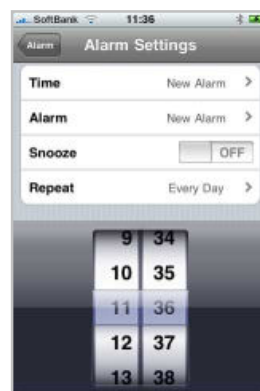
タイマー選択画面