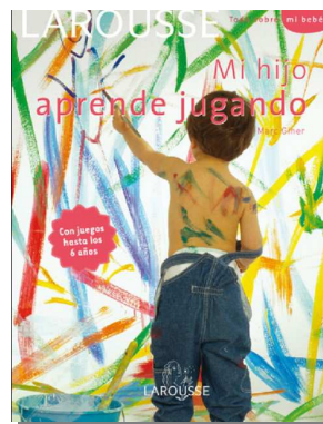
「 aprende jugando 」