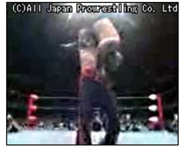
「橋本真也の垂直落下式ブレンバスター」

「FOMA / フォーマ」「着モーション」は、NTT ドコモの商標または登録商標です。