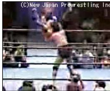
「天龍源一郎のパワーボム」