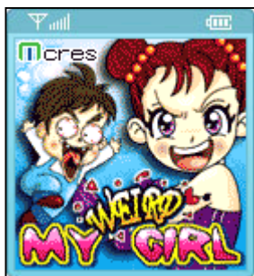
『My Weird Girl』のイメージ画像

今後もモバイルサービスの先端をいく韓国において、ゲーム開発の技術力を蓄積するほか、ゲーム以外の新規サービスの開発も視野に入れ、グローバルに向けた展開を図る。