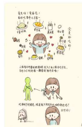
『喜欢你100个细节』のイメージ図