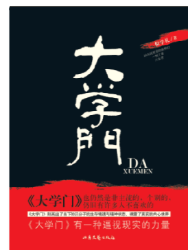
『大学門』のイメージ図