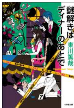
謎解きはディナーのあとで 著／東川篤哉