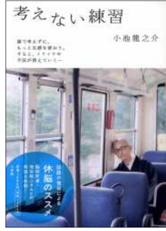
考えない練習 著/小池龍之介