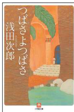
つばさよつばさ 著／浅田次郎