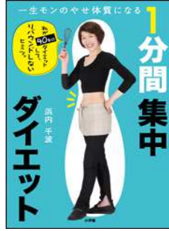
一生モンのやせ体質になる 1分間集中ダイエット 著/浜内千波