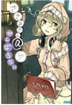
ガガガ文庫 ささみさん@ganbaranai 著/日日日