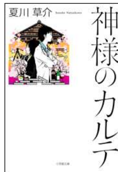
神様のカルテ 著／夏川草介