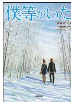
僕等がいた 著／高瀬ゆのか 原作／小畑友紀 脚本／吉田智子