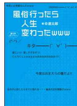
風俗行ったら人生変わった www 著／@遼太郎