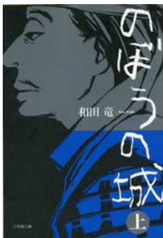
のぼうの城 著／和田竜