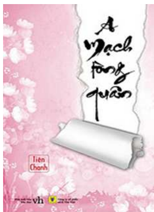
A Mạch tông quân