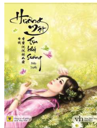
Hương mật tựa khói sương